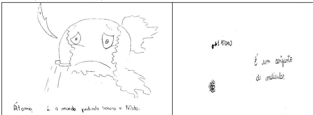
Figura 02- Algumas representações de átomos

Representação de camadas, núcleo e partículas: das setenta e três representações, vinte e três indicaram o átomo como uma circunferência com várias camadas, indicando partículas nessas camadas e um ponto central, aproximando-se das representações do livro didático utilizado pelas turmas (MORTIMER, 2013).